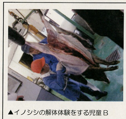
▲イノシシの解体体験をする児童B

見学直前、野生動物に対する子どもたちの思いは、意見が分かれていた。児童Cらは「優しくしたい」という意見であるのに対し、児童A、Bたちは「殺して食べたい」という思いを持っていた。