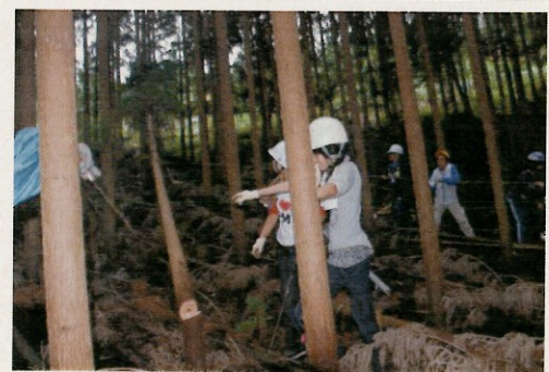
▲間伐体験をする子どもたち（9月）

子どもたちは、4月から「森」について学習を続けてきている。4月には乙川の源流を探しに行き、森から川が生まれていることを知った。また、学校周辺の森の調査活動をする中で、「間伐」について知り、9月には間伐体験を行っている。本小単元では、森の中に存在する「木」から「動物」へと子どもたちの視点を移し、野生動物との付き合い方を考えていく。野生動物の命を考える教育である。また、親や親戚が山を所有している本学級の子どもたちにとってみると、本実践は、環境教育にキャリア教育が加わったものだとも言える。