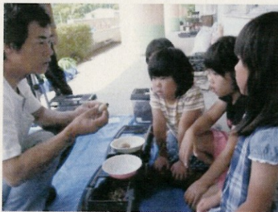
1年：カブトムシ博士に学ぶ

写真資料 山・川・街・海プロジェクトに関する資料 1年：カブトムシ博士に学ぶ 2年：乳牛の飼育体験での学び 3年：ヤママユガの飼育博士 6年：川浄化用炭焼き窯作り